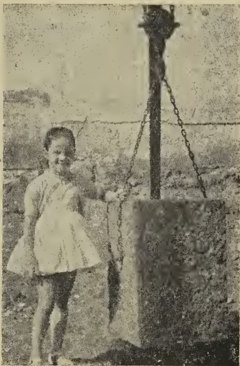
El futuro en buenas manos

Negrin trae la adhesión del Distrito rioplatense con el siguiente mensaje: